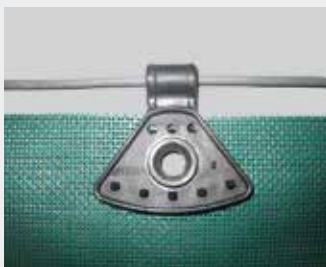
ohne Abbildung: Windschutzgewebe mit Ratschen-Spann- System (mit Ösen und Randverstärkung)