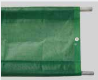
Windschutzgewebe mit Hohlraum oben und unten