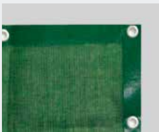
Windschutzgewebe mit Randverstärkung und Ösen