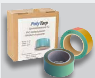
PolyTarp Spezialklebeband zum Reparieren von Windschutzgeweben, grün, 650 g/m 2 0,05 x 5 m 24 Stück/Karton